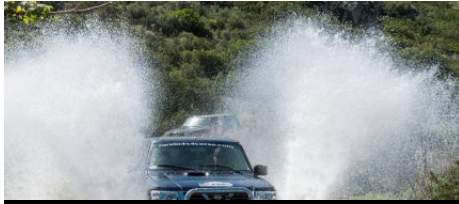
Rando 4x4 Corse

En amoureux, en famille ou en groupe, partez à la découverte de la campagne bonifacienne , avec son maquis odorant et ses points de vue époustouflants, en quad, 4x4 ou buggy. A bord de votre bolide, plus rien ne vous arrête !