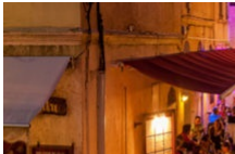
Arpenter la Citadelle

Si vous optez pour un séjour de plusieurs jours, tous les incontournables du Sud Corse sont à portée de main. C'est bon signe, si vous ne savez plus où donner de la tête 🤔