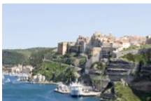
Entre mer & terre