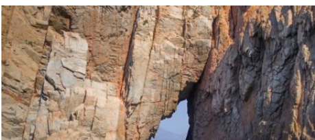
La géologie de la Corse