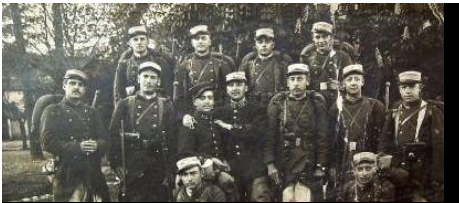
L'Histoire de la Corse