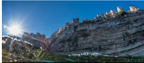
La Corse et ses microrégions