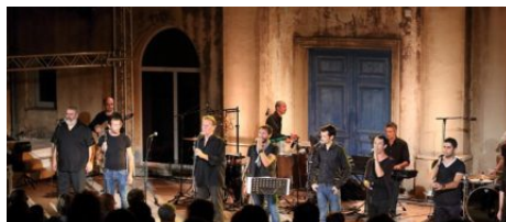
Les polyphonies corses