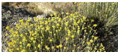
Le Maquis Corse