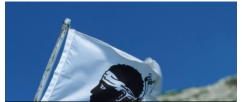
Le drapeau corse / A bandera corsa