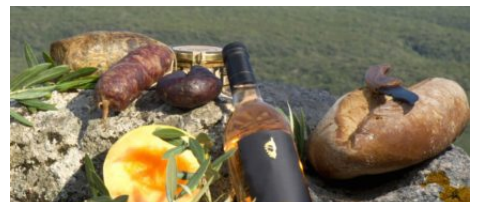
La gastronomie Corse