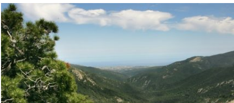
Les montagnes corses