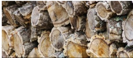
Le liège en Corse