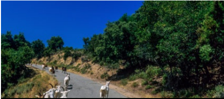
La faune corse