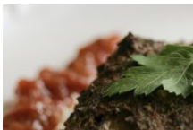
Les aubergines à la Bonifacienne