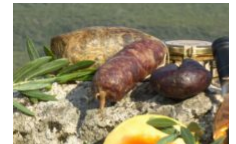
La gastronomie Corse