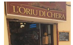
Epicerie l'Oriu di Chera