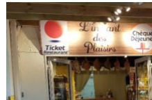
Épicerie du terroir l'instant des plaisirs