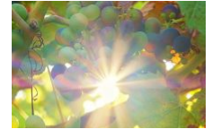
Vignoble Buzzo Bunifazzu