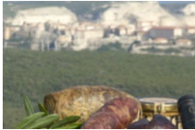
Strada di i Sensi – Partez sur la Route des Sens Authentiques