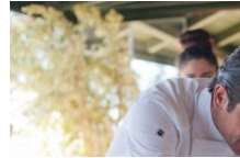
Produits locaux – Les professionnels engagés