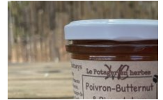
Le potager en herbes