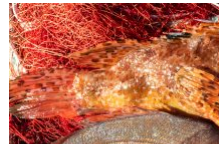
La pêche locale