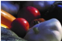
Le maraîchage et ses produits dérivés