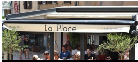
Restaurant La Place