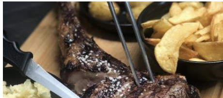
Restaurant Da Rocca