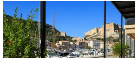
Restaurant Centre Nautique