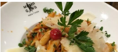
Restaurant Mama Gina