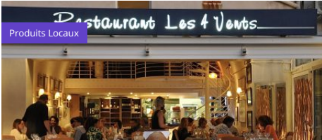
Restaurant les 4 vents