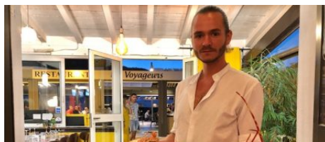
Restaurant Les Voyageurs