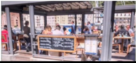
Restaurant Côté Fruits de Mer