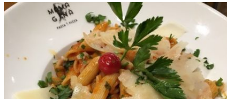
Restaurant Mama Gina