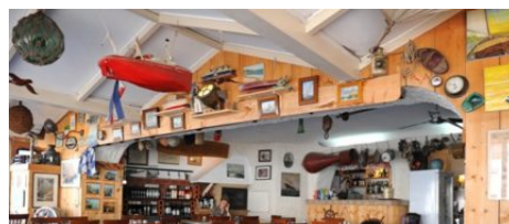
Restaurant Cantina Grill