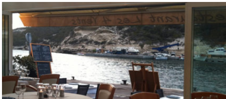
Restaurant Les 4 vents

Agréablement installé sur les quais vous n'aurez qu'à profiter du ballet incessant des bateaux pour déjeuner ou pour dîner. Familles avec enfants, couples en séjour farniente, groupes organisés, ici, vous trouverez le restaurant qui vous correspond.