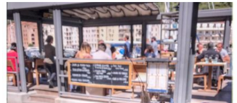
Restaurant Côté Fruits de Mer