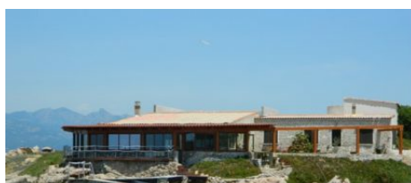
Restaurant Chez Marco