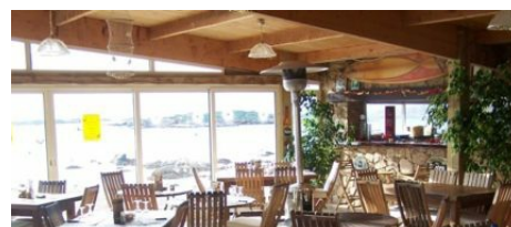
Restaurant Goeland Beach