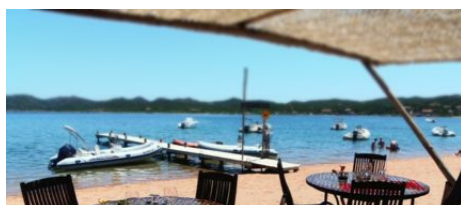
Restaurant Maora Beach

Du restaurant gastronomique avec le vivier à langouste, à la paillote branchée avec une cuisine méditerranéenne, en passant par la pizzeria et sans oublier les merveilleux couchers de soleil , il y a autant de couleur dans le décor que dans votre assiette. Venez découvrir les spécialités locales dans une atmosphère dépayssante. C'est ça les vraies vacances !