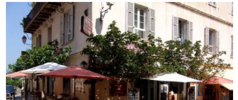
Restaurant Le Royal