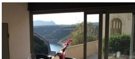
Restaurant Aria Nova