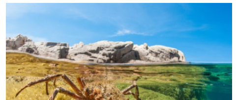
Restaurant l'O2 Mer