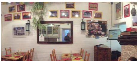
Restaurant La Bodega

Des plats goûteux et parfois maison, parfois faits avec des produits du jardin, que vous pourrez apprécier en même temps que la vue et l'ambiance au cœur des remparts.