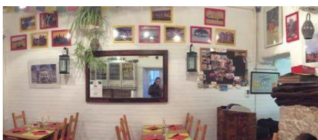
Restaurant La Bodega