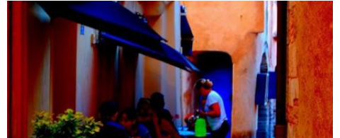
Restaurant La Loggia