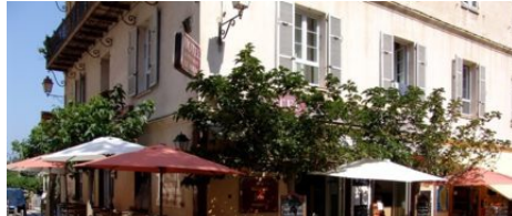
Restaurant Le Royal