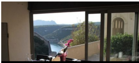
Restaurant Aria Nova