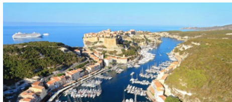
Restaurant l'O2 Mer