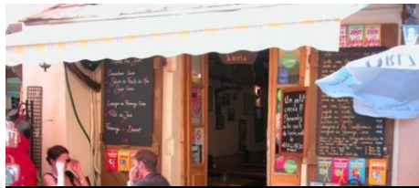
Restaurant Cantina Doria