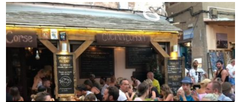
Restaurant l'Auberge Corse