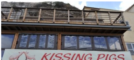
Restaurant Kissing Pigs