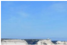
Vin à Bonifacio

Pêche, fromage, vin, huile d'olive, fruits & légumes, miel, liqueur... à venir.