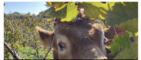
Vignoble Buzzo Bunifazziu