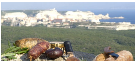
Strada di i Sensi : la route des producteurs et des artisans