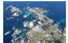
Une escapade sur les îles Lavezzi