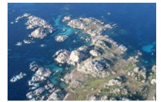
Une escapade sur les îles Lavezzi