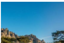
Top 20 des incontournables à découvrir absolument dans le Sud Corse