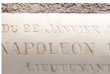
Napoléon Bonaparte est il originaire de Bonifacio ?