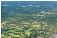
Sea, sun & fun