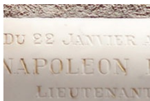
Napoléon Bonaparte est il originaire de Bonifacio ?