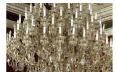
D'Ajaccio à Bonifacio : sur les traces de Napoléon Bonaparte.