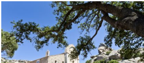
L'Ermitage de la Trinité de Bonifacio