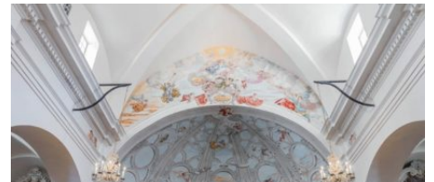
La Paroisse de Bonifacio