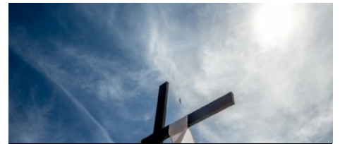
Les confréries de Bonifacio