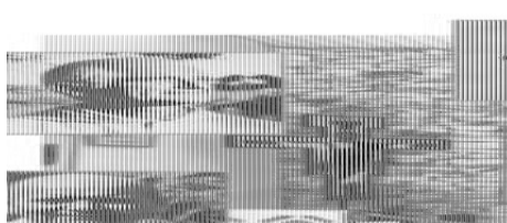
Oratoire Notre-Dame de Tibhirine