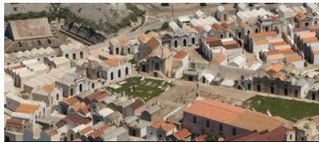
Le Cimetière Marin de Bonifacio