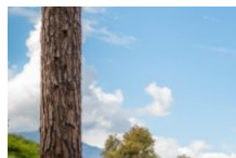
Hélicoptère Héli Sud Corse