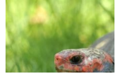
A Cupulatta, le parc des tortues en Corse