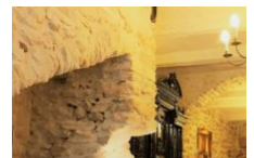
Restaurant U Castille