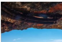
Le Gouvernail à Bonifacio