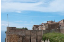
Pass Monuments « Faites d'une pierre deux coups »