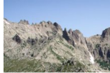
Le GR20 en Corse