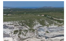
Sentier de Pertusatu