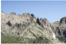
Le GR20 en Corse