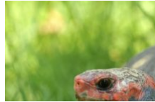
A Cupulatta, le parc des tortues en Corse