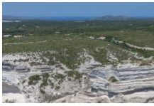
Sentier de Pertusatu