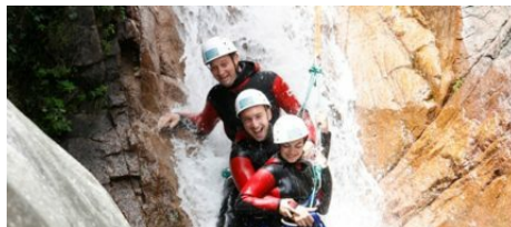
Parc aventure Acqua & Natura