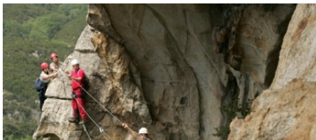
Via Ferrata Chisa en Corse du Sud