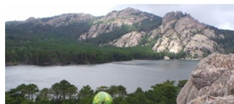
Parcours Aventure Xtrem Sud