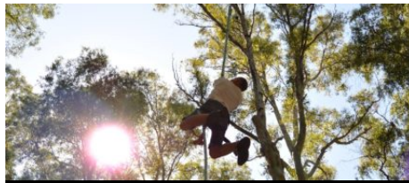
Parc Aventure Porto-Vecchio