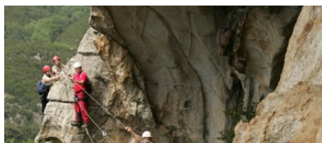
Via Ferrata Chisa en Corse du Sud

Les amateurs de sensation fortes trouveront leur bonheur ici ! Le Sud Corse dispose d'un massif montagneux à couper le souffle. Entre terre et mer et toujours attaché, laissez-vous aller aux tyroliennes qui traversent des rivières, à la Via Ferrata en Corse du Sud qui vous offre une vue sur la Méditerranée. Pour les moins courageux, des parcours d'accrobranche en douceur sont possible.