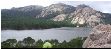
Parc Aventure et via ferrata Xtrem Sud

Les amateurs de sensation fortes trouveront leur bonheur ici ! Le Sud Corse dispose d'un massif montagneux à couper le souffle. Entre terre et mer et toujours attaché, laissez-vous aller aux tyroliennes qui traversent des rivières, à la Via Ferrata en Corse du Sud qui vous offre une vue sur la Méditerranée. Pour les moins courageux, des parcours d'accrobranche en douceur sont possible.