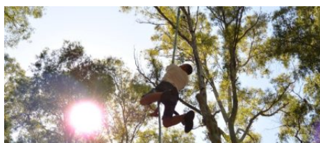
Parc Aventure Porto-Vecchio