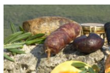
La gastronomie Corse