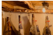
Épicerie de terroir Casa Lucchini