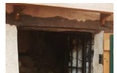
L'Orée du Maquis