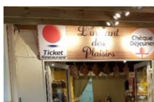
Épicerie du terroir l'instant des plaisirs