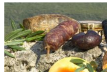
La gastronomie Corse