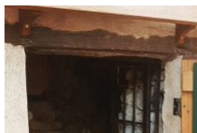
Produits locaux – Les professionnels engagés