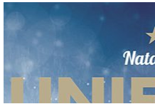
Marché de Noël – Natali in Bunifazziu