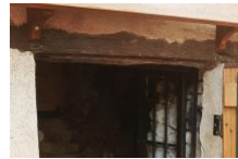
L'Orée du Maquis