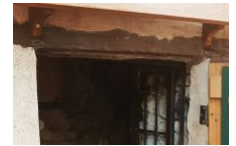
Strada di i Sensi – Partez sur la Route des