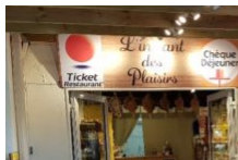
Épicerie du terroir l'instant des plaisirs