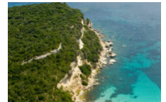
Plage de Canetto / Canettu