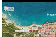
Voici un bon plan pour tout voir