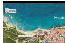
Voici un bon plan pour tout voir