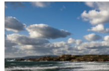
Plage de Stagnolu