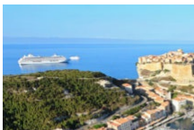
Café de la Poste Bar-PMU