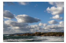
Plage de Stagnolu