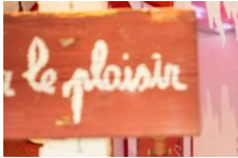
Marché de Noël – Natali in Bunifazziu