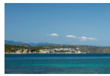
Plage de Sant'Amanza