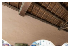
Le marché du mardi matin