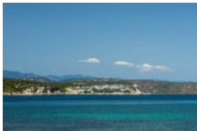
Plages de Sant'Amanza