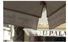
Glacier U Palazziu