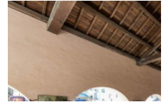
Le marché du mardi matin