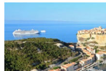
Café de la Poste Bar-PMU