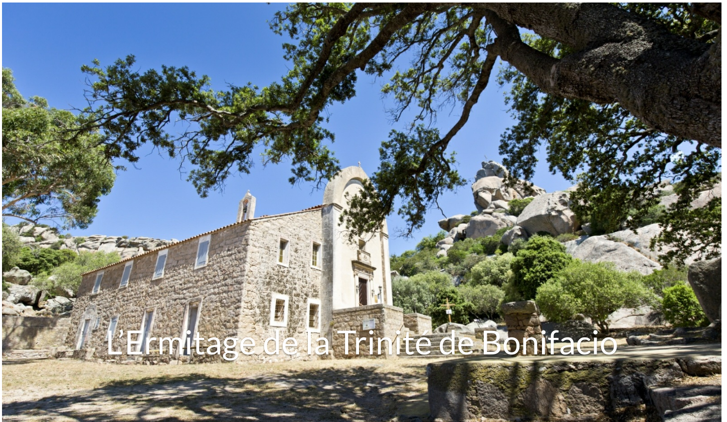
L'Ermitage de la Trinité de Bonifacio Ermitage de la trinité de Bonifacio Dans la campagne 20169 Bonifacio

L'Ermitage de la trinité se situe à 5 minutes de Bonifacio dans le Sud-Corse. Cet endroit insolite est perché à 200 mètres d'altitude, surplombant ainsi les Bouches de Bonifacio et la Sardaigne.