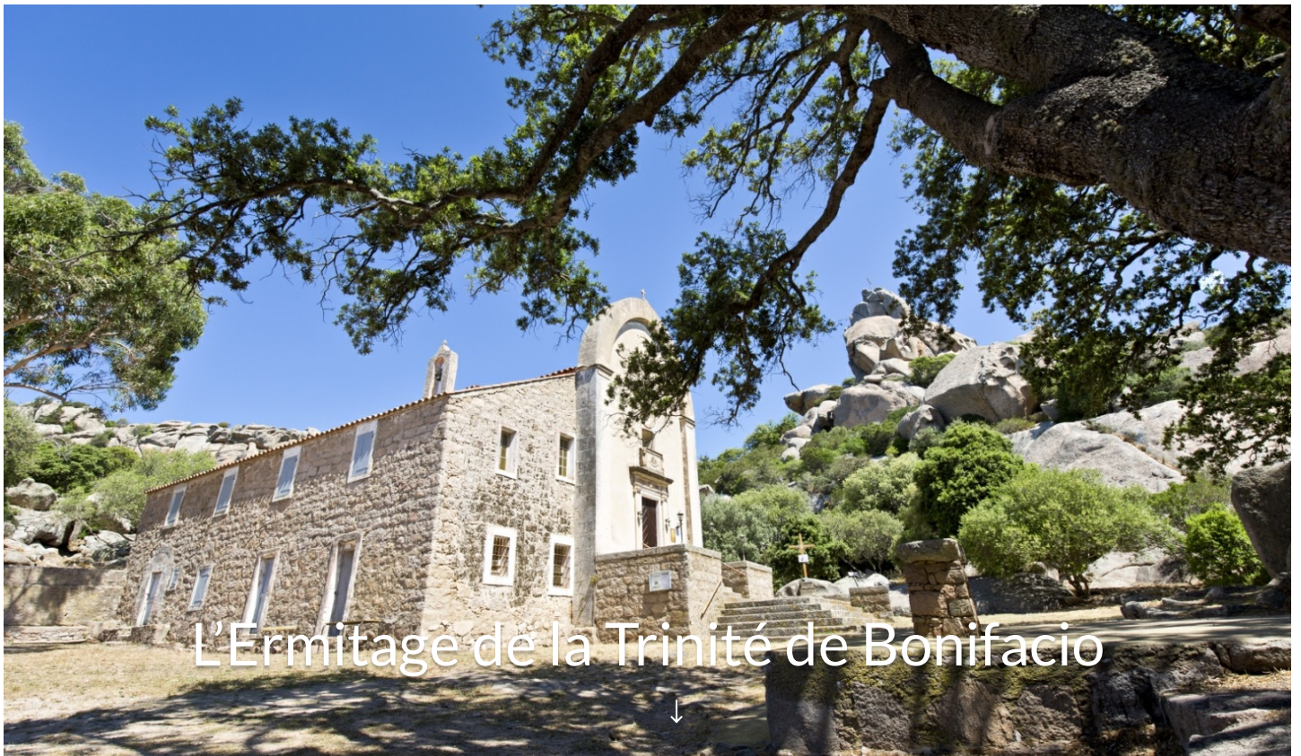
L'Ermitage de la Trinité de Bonifacio Ermitage de la trinité de Bonifacio Dans la campagne 20169 Bonifacio

L'Ermitage de la trinité se situe à 5 minutes de Bonifacio dans le Sud-Corse. Cet endroit insolite est perché à 200 mètres d'altitude, surplombant ainsi les Bouches de Bonifacio et la Sardaigne.