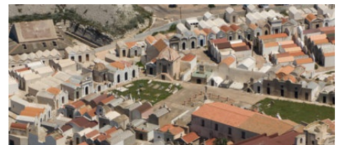
Le Cimetière Marin de Bonifacio