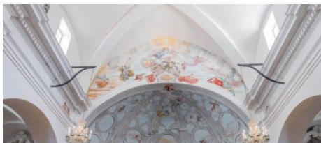
La Paroisse de Bonifacio

La vie religieuse à Bonifacio est très marquée, elle représente la ville mais aussi ses habitants qui contribuent et participent activement à celle-ci. En effet, les Bonifaciens sont très souvent membres de l'une des 5 confréries qui animent la ville.