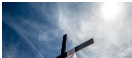
Les confréries de Bonifacio