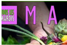
Le marché de Bonifacio pour Noël