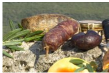
La gastronomie Corse