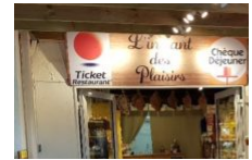
Épicerie l'instant des plaisirs