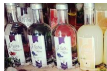
Distillerie du Maquis