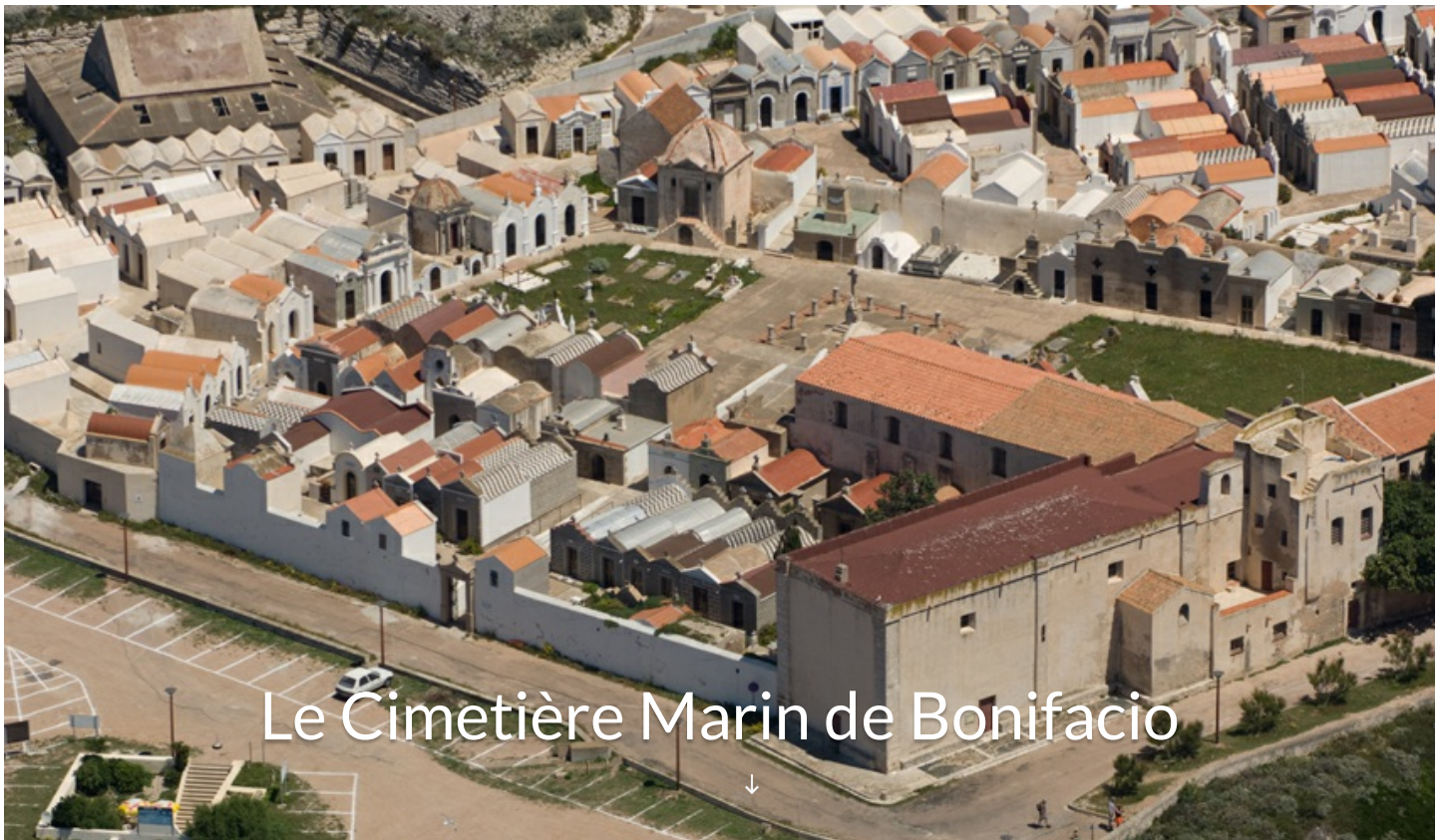
Le Cimetière Marin de Bonifacio Quartier Saint-François 20169 Bonifacio

Sur le plateau du Bosco, situé à quelques pas de l'Eglise Saint-François, faisant face à la mer, le cimetière marin de Bonifacio ou Campu Santu comme le nomme les bonifaciens a la réputation d'être l'un des plus beaux de Méditerranée.