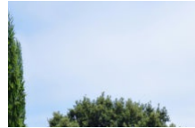
Le Parc de Saleccia