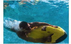
Activités nautiques Seabob Officiel Corse