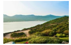
Hôtel U Capu Biancu