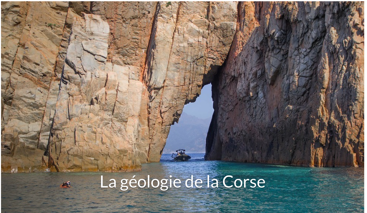
La géologie de la Corse