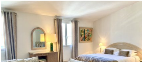
Hôtel La Caravelle