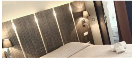
Locations chambres l'Escale