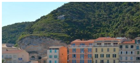
Hôtel Best Western Roy d'Aragon

Hôtel Clef verte ★★★ 3 étoiles 📍 Bonifacio