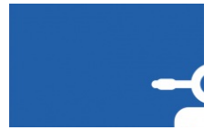
Scooters et motos