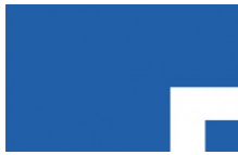
Les parkings de Bonifacio