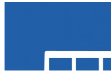
Bus et autocars