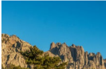
Top 20 des incontournables à découvrir absolument dans le Sud Corse