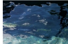
Bain de Caldane : source thermale dans l'Alta- Rocca