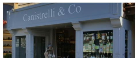
Épicerie fine Canistrelli and Co