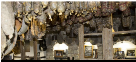
Épicerie du terroir Roba Nostra