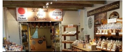
Épicerie du terroir l'instant des plaisirs