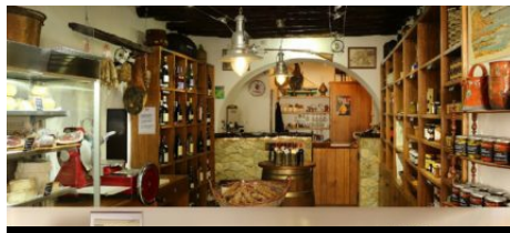
Épicerie du terroir A Bitiga di u Rastillu