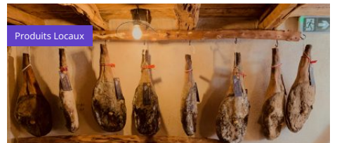
Épicerie de terroir Casa Lucchini