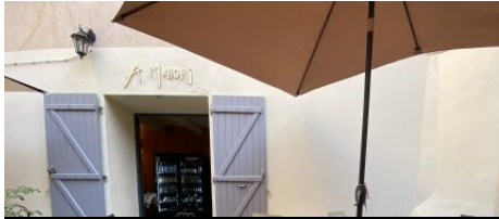
Épicerie de terroir A Maiori