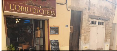
Epicerie l'Oriu di Chera