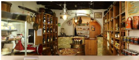
Épicerie A Bitiga di u Rastillu

Ici découvrez le « Spuntinu », assiette typique et conviviale où vivent en harmonie le vin, la charcuterie et le fromage accompagné de sa confiture de figue. Vous pouvez aussi ramener un petit bout de Corse à la maison et faire partager vos expériences à vos amis.