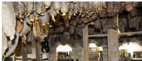
Épicerie du terroir Roba Nostra