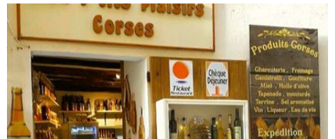
Épicerie Aux p'tits plaisirs Corses