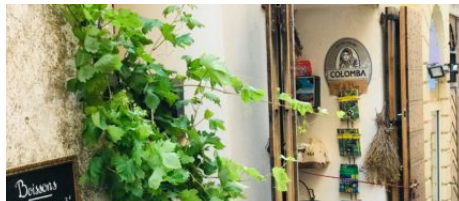
Épicerie du terroir l'Antigu