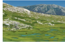
A Muvrella Randonnées