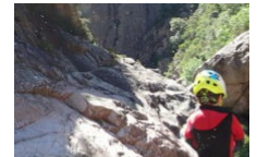
Canyoning Aqa Canyon