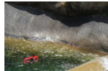
Canyoning Bavella Canyon