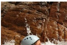
Canyoning ABC Roberto Canyon