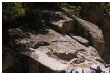
Canyoning Corse Montagne