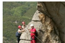
Via Ferrata Chisa en Corse du Sud