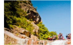
Canyoning Corsica Canyon