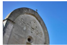
Patrimoine religieux de Bonifacio