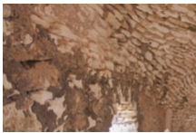
Citadelle médiévale de Bonifacio