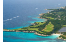
Le Top 10 des plages en Corse