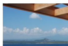
Locations La Tonnara