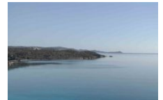
Activités nautiques Maora B'Ch Sailing Club