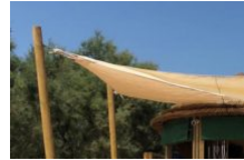
Location de bateaux Nautic Aventures Maora