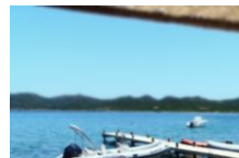
Restaurant Maora Beach