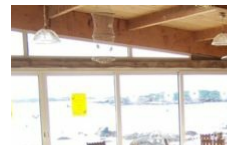
Restaurant Goeland Beach