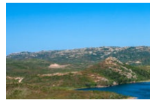
La plage de Balistra