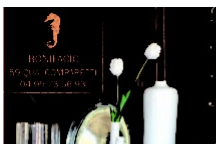
Boutique Cavallo di Mare