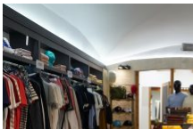
Boutique Mon Bijou