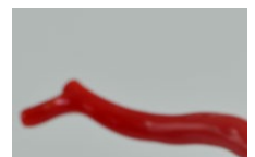
Les Terrasses d'Aragon à la Marine