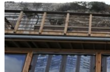
Restaurant Kissing Pigs