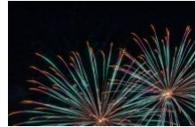
Feu d'artifice du 8 septembre