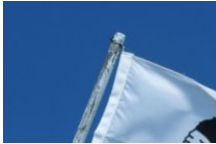
Atour de Bonifacio