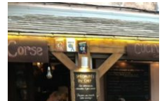
Restaurant l'Auberge Corse