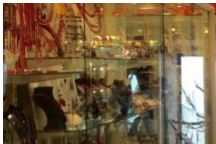
La Boutique du Corailleur