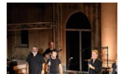
Les polyphonies corses