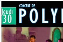
Concert polyphonique A Pasqualina