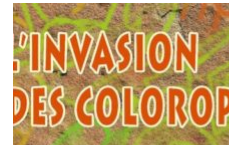
Exposition « L'invasion des Colorophages » par