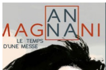
Théâtre : « Anna Magnani, le temps d'une messe »