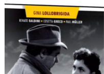
Ciné-club : « Traqué dans la ville »