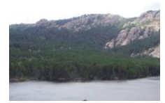
Parcours Aventure Xtrem Sud