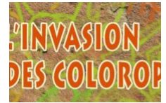
Exposition « L'invasion des Colorophages » par