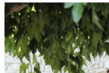
Visite guidée enfants : enquête au Moyen Âge