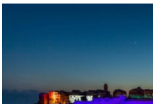
Festi Lumi, le festival des lumières