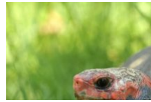
A Cupulatta, le parc des tortues en Corse