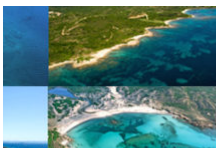
Toutes les plages de Bonifacio

En poursuivant votre navigation sur ce site, vous acceptez l'utilisation de Cookies. En savoir plus