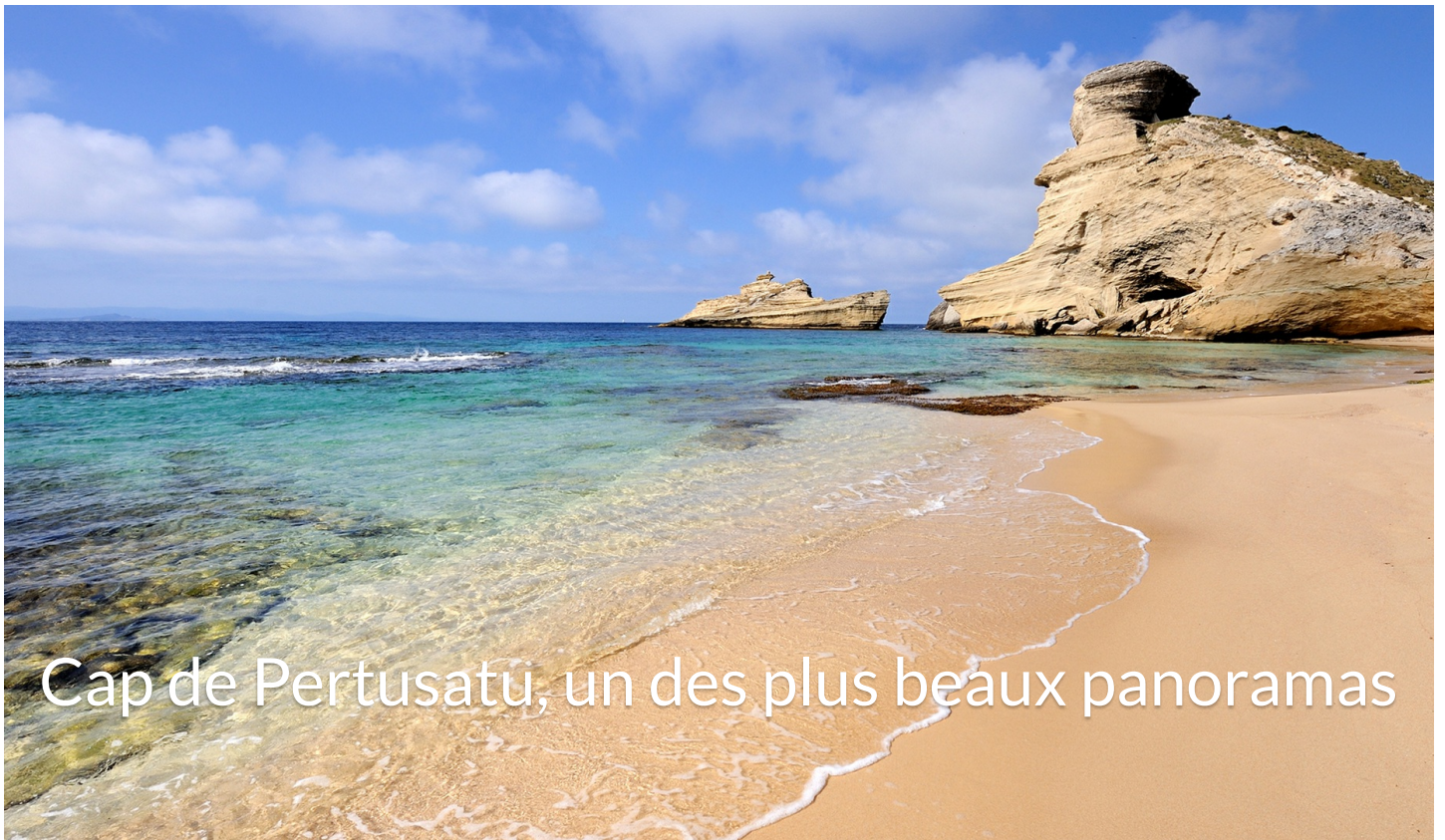
Cap de Pertusatu, un des plus beaux panoramas