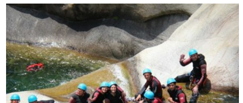
Canyoning Bavella Canyon