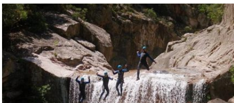
Canyoning Corse Montagne