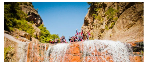
Canyoning Corsica Canyon