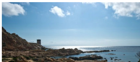
Canyoning Alpa Corse