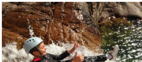
Canyoning ABC Roberto Canyon