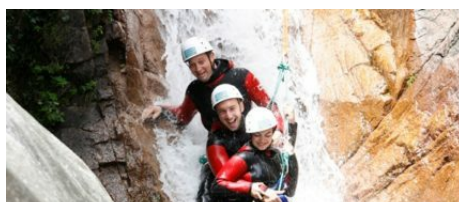
Parc aventure Acqua & Natura