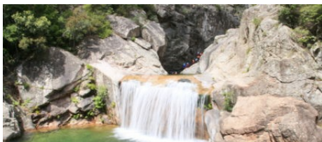
Canyoning Corsica Forest

Infos : un arrêté préfectoral restreint du vendredi 1er juillet au jeudi 15 septembre 2022 inclus l'accès au canyon de la Purcaraccia, situé sur la commune de Quenza, aux seuls groupes accompagnés et encadrés par un professionnel habilité.