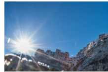
Conférence : la vie d'un déchet. Week-end éco'festif.