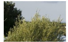
Camping Pian del Fosse