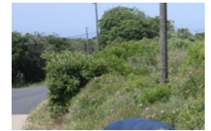
Nature Propre. Week-end éco'festif.