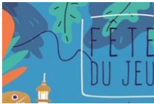
Fête du jeu. Week-end éco'festif.