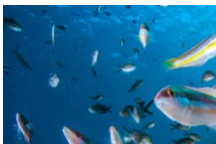
Plongée dans notre Aquarium Géant