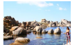
Gaies les pagaies !