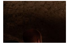
Film – Le Torrione de Bonifacio, une fortification médiévale au cœur des guerres méditerranéennes