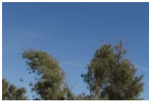
Parcours Patrimonial, Bonifacio Autrement

Cet automne, découvrez le patrimoine culturel de Bonifacio d'un œil nouveau. Vous pourrez déambuler dans la cité médiévale et découvrir différents chapitres de l'Histoire bonifacienne en suivant le parcours patrimonial Bonifacio Autrement. Si vous avez des enfants, n'hésitez pas à leur faire télécharger les Mystères de Pif, application et jeu grandeur nature au cours duquel il leur faudra résoudre des énigmes en parcourant la Haute-Ville. Faites un stop avec eux à la Médiathèque pour contempler les œuvres du musée numérique Micro-Folie sur grand écran ou casque de réalité virtuelle. Ou participez à la projection du film sur le Torrione de Bonifacio dans une des salles souterraines du Bastion de l'Étendard. Une offre variée, mêlant technologie et patrimoine et permettant de profiter de Bonifacio par tous les temps.