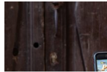
Jeu – Les Mystères de Pif