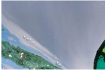
Base nautique Nustrale Ride