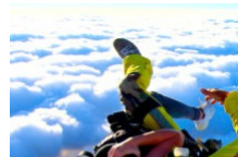
Ecole de Parachutisme du Valinco