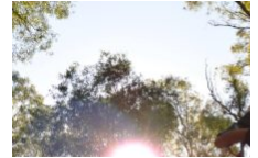
Parc Aventure Porto-Vecchio