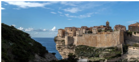
Sentier Campu Rumanilu

Avec des à-pics qui vont jusqu'à 110 mètres, vous serez surpris par les goélands qui planent sous vos pieds. Chargez les piles de votre appareil photos, il va chauffer ! Mais surtout, restez prudent et surveillez bien vos enfants.